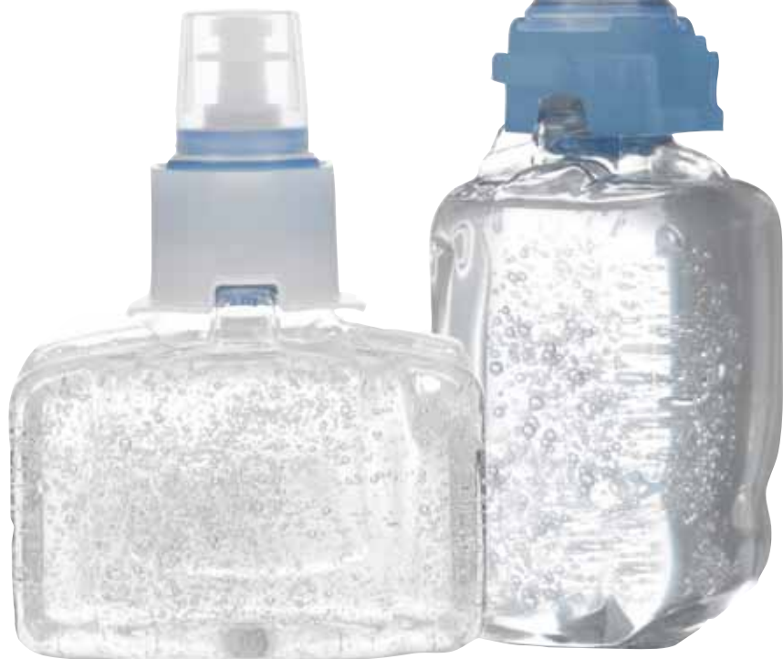
PURELL Advanced Ontsmettende Handgel 1303-03-EEU00

Purell BRAND® ADVANCED ONTSMETTENDE HANDGEL