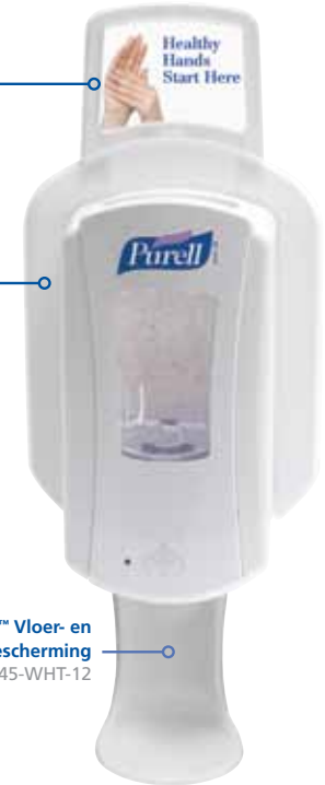
SHIELD™ Vloer- en wandbescherming 1045-WHT-12